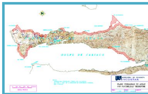
■ Plano preliminar de áreas con factibilidad Terrestre.