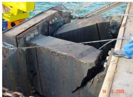
■ Detalle del deterioro de las defensas existentes.

Incostas realizó todas estas actividades de forma simultanea y bajo las mas estrictas normas normas de seguridad, higiene y ambiente.