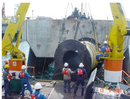
■ Instalación de las nuevas defensas.