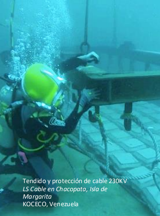
Tendido y protección de cable 230KV LS Cable en Chacopata, Isla de Margarita KOCECO, Venezuela